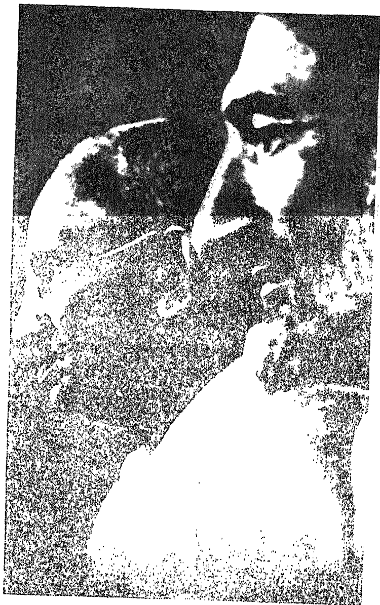
सरहदी गाँधी के साथ