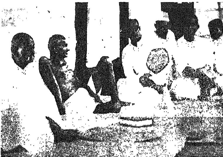
कांग्रेस कार्यकारिणी समिति की बैठक में

गांधीजी ने कहा कि "मैं मोची को ही यहाँ बुला दूँगा।" और गांधीजी ने तीस बरस पहले देखे हुए "औखाई जोड़े" का नमूना